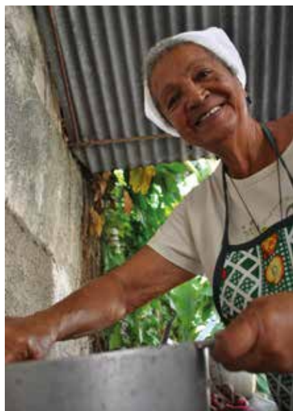
Voluntaria de un comedor en Candelaria.

de los nietos, constituye un modo privilegiado de cualificar las relaciones y salir al paso de la posible soledad.